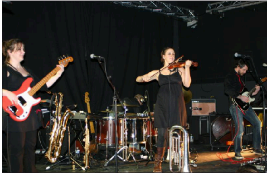
■ La Roulette Rustre a offert un concert de grande qualité, dégusté par le public.

Les Fonds de Tiroirs et Oestrogena Orchestra ont contribué à lancer l'ambiance qui a encore enflé lorsque La Roulette Rustre est entrée en scène pour présenter son nouveau spectacle « Second Souffle ». Un festival d'improvisations rock, de chansons et d'explorations sonores exécutées par des professionnels talentueux qui ont enthousiasmé le public. Et dans une communion entre musiciens et public, l'anniversaire s'est prolongé jusque tard dans la nuit.