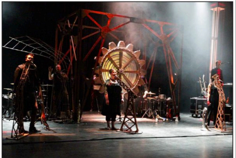
Second souffle : une pièce à machine, un concert théâtral, une émotion nouvelle !

L'idée originale de ce nouveau spectacle s'est forgée lors d'ateliers musicaux auprès de personnes en situation de handicap mental, de détenus, et d'enfants, dont le point commun est de vivre dans un rap-