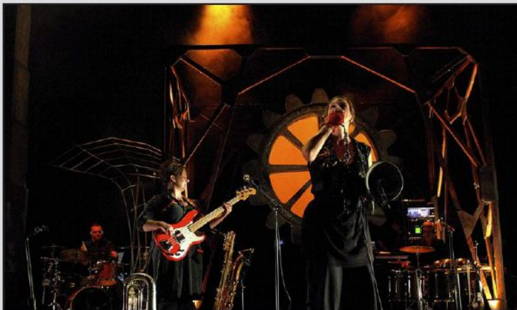
La Roulette rustre, de remarquables artistes, chanteurs et multi-instrumentistes.