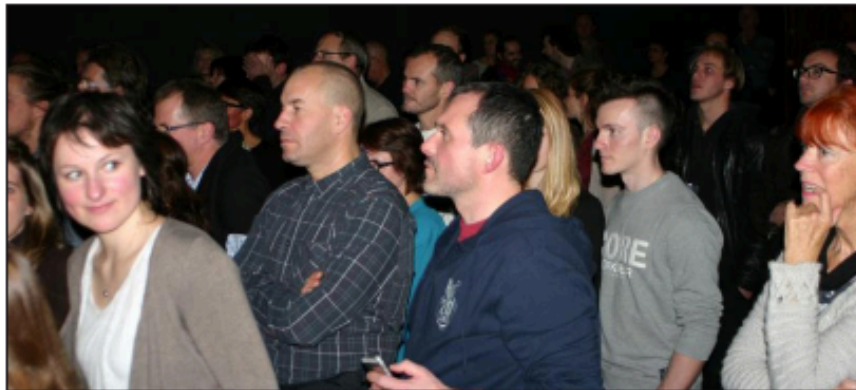
■ Un public admiratif devant la qualité musicale de La Roulette.