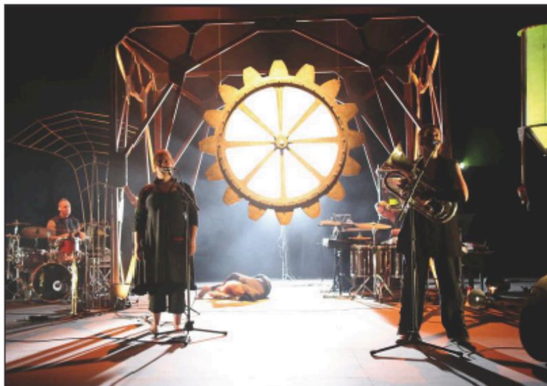
■ Dernière répétition pour le spectacle « 2nd Souffle ».