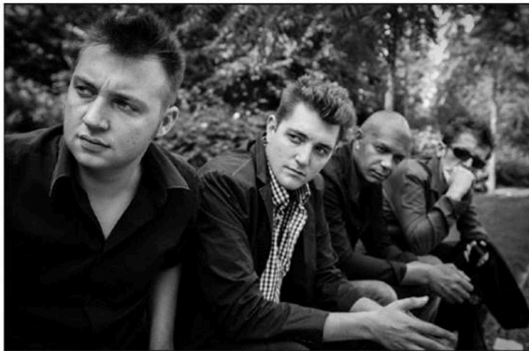
Invité de la Roulette rustre , le groupe "Tournée générale" et ses interprétations, de Paccoud à Ferré...

L'idée originale a été forgée lors d'ateliers musicaux auprès de personnes en situation de handicap mental, de détenus, et d'enfants, dont le point commun est de vivre dans un rapport au temps différent du nôtre. Entre le temps objectif, imposé par les horloges et la durée subjective, la musique crée une tension, un combat, provoque des frottements, des éclats : Le public en sort bouleversé dans ses repères. Second souffle est une expérience tem-