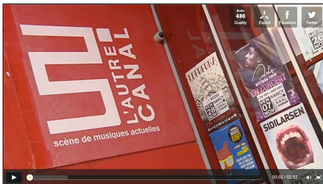
Avant première du clip 'Un peu d'air'